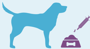
1 ml přípravku Veticalm® na 1 kg tělesné hmotnosti. Jednoduše přidejte do jídla.